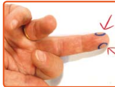
Prik in de vinger